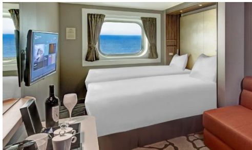
Ocean view Room