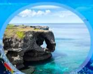
ผามันซาโมะ