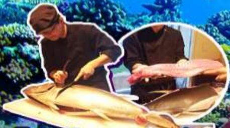
พิเศษ!! ชามู ชามู สไตลิ่งญี่ปุ่น

บุฟเฟ่ต์เทป็นยากพร้อมชิมปลาฤดูนำโดยเชฟมาแลให้กินแบบสดๆ!!