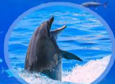
ชมโชว์โลมา