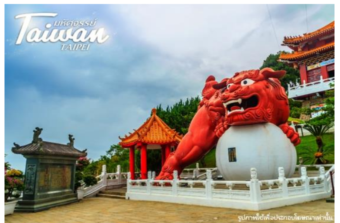
รูปภาพใช้เพื่อประกอบโฆษณาเท่านั้น

นำท่าน ชิมชาอู่หลง และ ชมการสาธิตการชงชาแบบต่างๆ เพื่อให้ท่านได้ชงชาอย่างถูกวิธีและได้รับประโยชน์จากการดื่มชา ทั้งชาอู่หลงจากอาลีซาน ชาจากเมืองฮัวเหลียน และเลือกซื้อชาอู่หลงที่ขึ้นชื่อของไต้หวันไปเป็นของฝากและดื่มทานเอง