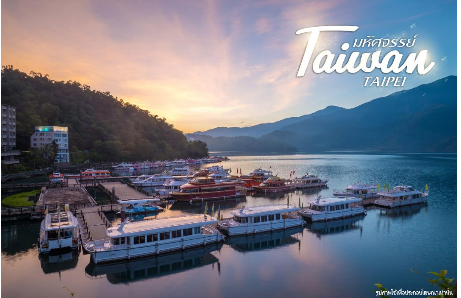
รูปภาพใช้เพื่อประกอบโฆษณาเท่านั้น