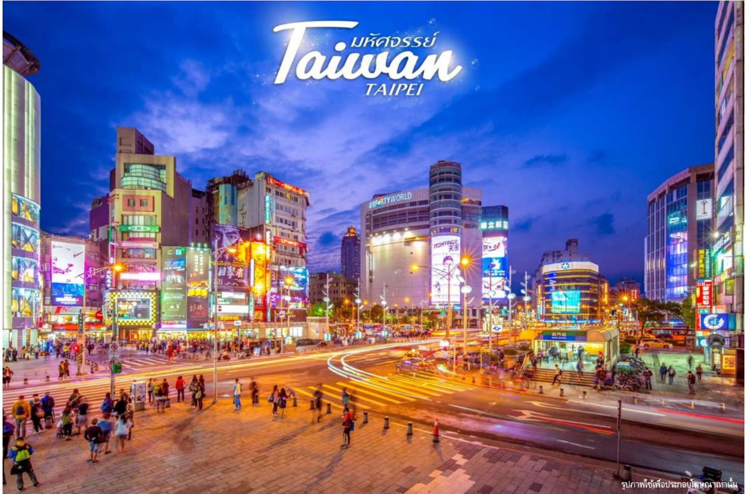
รูปภาพใช้เพื่อประกอบโฆษณาเท่านั้น

ที่อยู่ : 18 ซ.บุญศิริ52(สุขุมวิท27) ถ.สุขุมวิท ต.ปากน้ำ อ.เมือง จ.สมุทรปราการ 10270 เวลาทำการ : จันทร์ - ศุกร์ 08.30-17.30 น. เสาร์ 8.30-12.00 น.