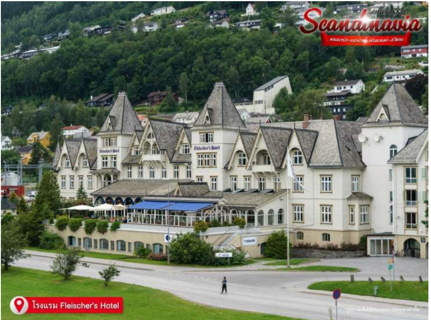
โรงแรม Fleischer's Hotel

ที่อยู่ : 18 ซ.บุญศิริ52(สุขุมวิท27) ถ.สุขุมวิท ต.ปากน้ำ อ.เมือง จ.สมุทรปราการ 10270 เวลาทำการ : จันทร์ - ศุกร์ 08.30-17.30 น. เสาร์ 8.30-12.00 น.