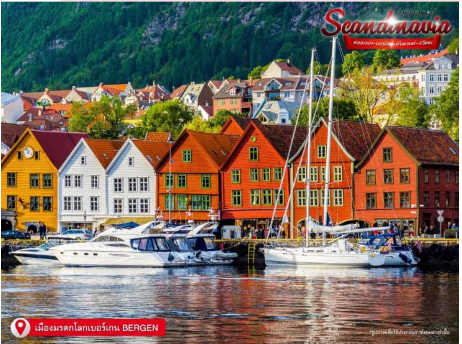
เมืองมรดกโลกเบอร์เกน BERGEN

MUST DO การล่องเรือระหว่าง ฟลอม Flam และ กัวควาเกิน Gudvangen นั้นถือว่าเป็นทริปที่ห้ามพลาด เพราะเป็นการล่องเรือชมฟยอร์ดที่สวยงามๆ ถ้าใครที่ชอบชมวิวระหว่างทาง การล่องเรื่อนี้ถือว่าเป็นห้ามพลาดเด็ดขาด