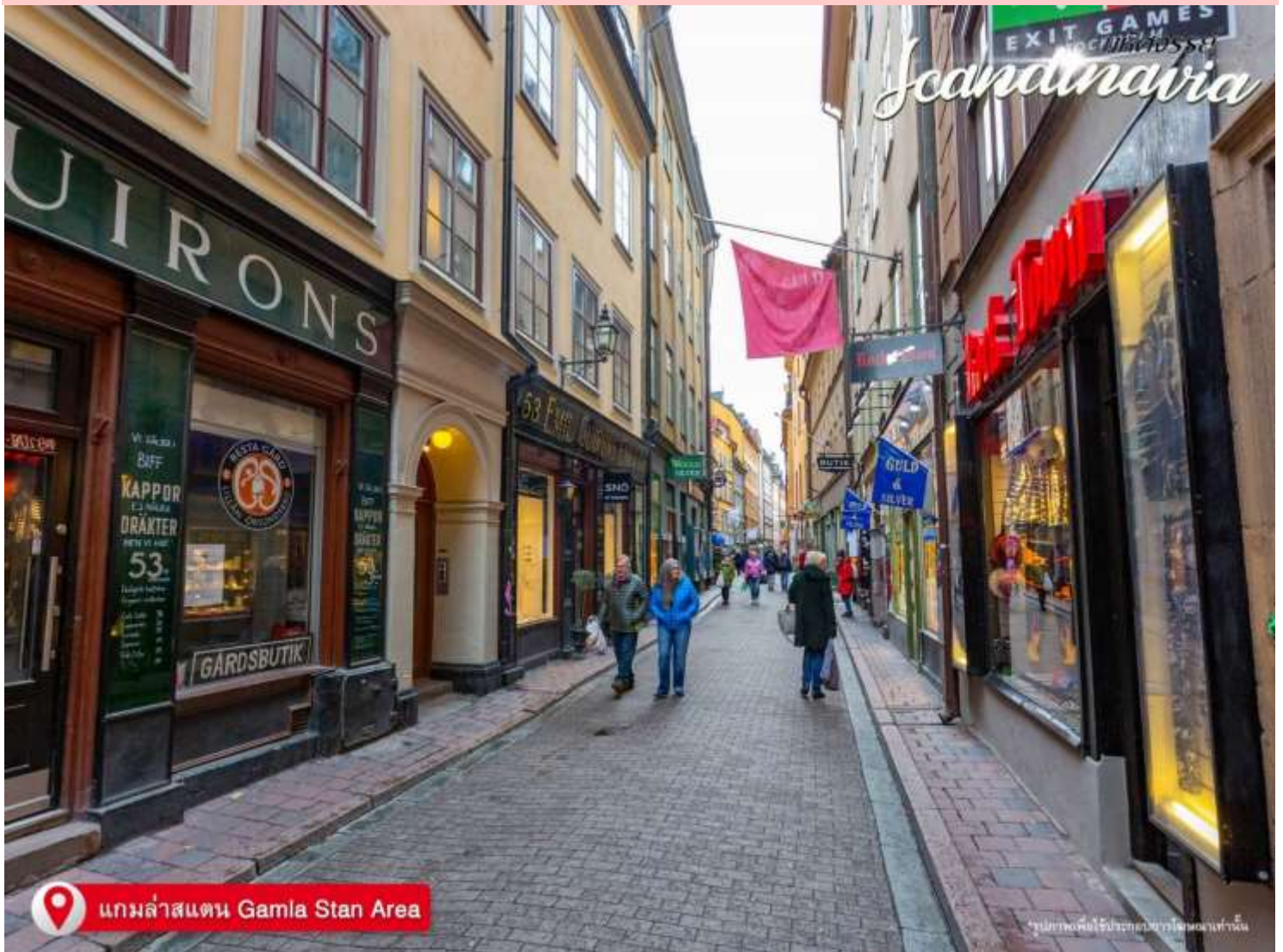
แกมล่าสแตน Gamla Stan Area

***สถานที่ช้อปปิ้งในยุโรปบางแห่งจะปิดวันอาทิตย์ถ้าท่านต้องการช้อปปิ้งสินค้าแบรนด์เนม กรุณาเช็ควันเดินทางของท่านก่อน ตัดสินใจซื้อโปรแกรมทัวร์ครับ***