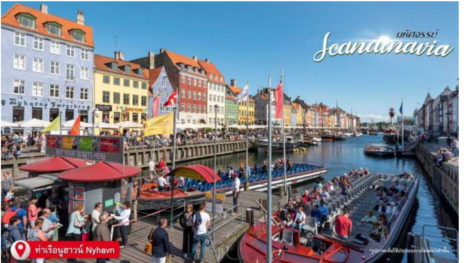
ท่าเรือนูฮาวน์ Nyhavn

เป็นเขตท่าเรืออันเก่าแก่ของโคเปนเฮเกน ตั้งอยู่ริมฝั่งตะวันออกของตัวเมือง ตามประวัติได้กล่าวไว้ว่า พระเจ้าเฟรเดอริกที่ 5 ทรงรับสั่งให้สร้างท่าเรือโกสส์ ตัวเมืองหลวง เพื่อให้สะดวกต่อการขนย้ายสินค้า และใช้เป็นท่าเรือพาณิชย์สำหรับเรือจากทั่วทุกมุมโลกมาเทียบท่า ในวันอากาศดีก็ถือเป็นศูนย์รวมของนักท่องเที่ยว สามารถเลือกทานอาหารชมบรรยากาศชิลๆ