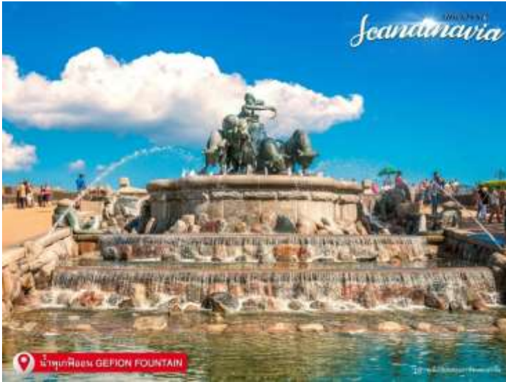
น้ำพุพืดเกม GEPION FOUNTAIN

ที่อยู่ : 18 ซ.บุญศิริ2(สุขุมวิท27) ถ.สุขุมวิท ต.ปากน้ำ อ.เมือง จ.สมุทรปราการ 10270 เวลาทำการ : จันทร์ - ศุกร์ 08.30-17.30 น. เสาร์ 8.30-12.00 น.