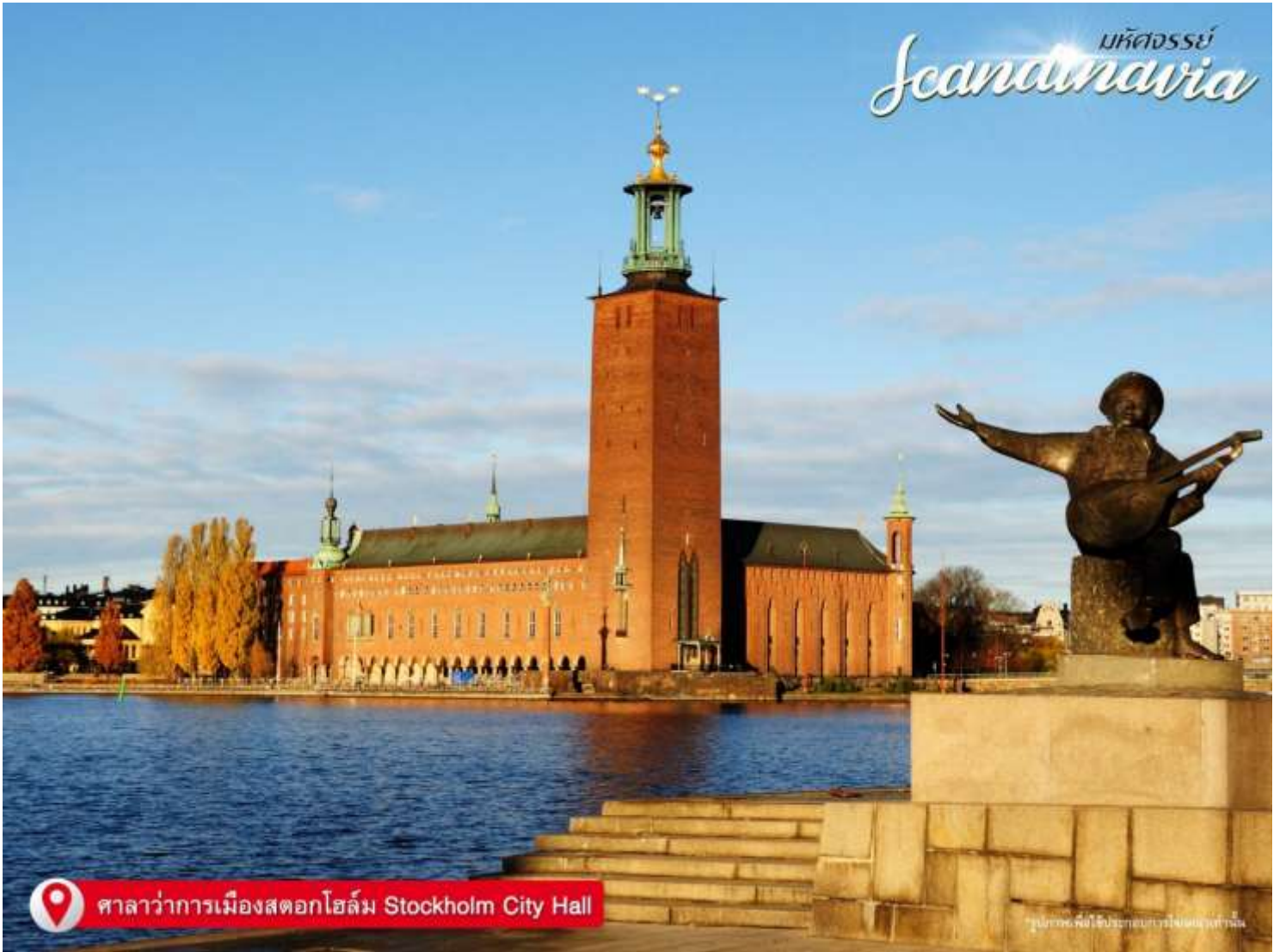
ศาลาว่าการเมืองสตอกโฮล์ม Stockholm City Hall

หลังคาด้วยหินโมเสก สร้างเสร็จสมบูรณ์ในปี 1911 และทุกๆ วันที่ 10 ของเดือนธันวาคมของทุกปี จะมีพิธีเลี้ยง รับรองผู้ได้รับรางวัลโนเบล (Nobel Prize)