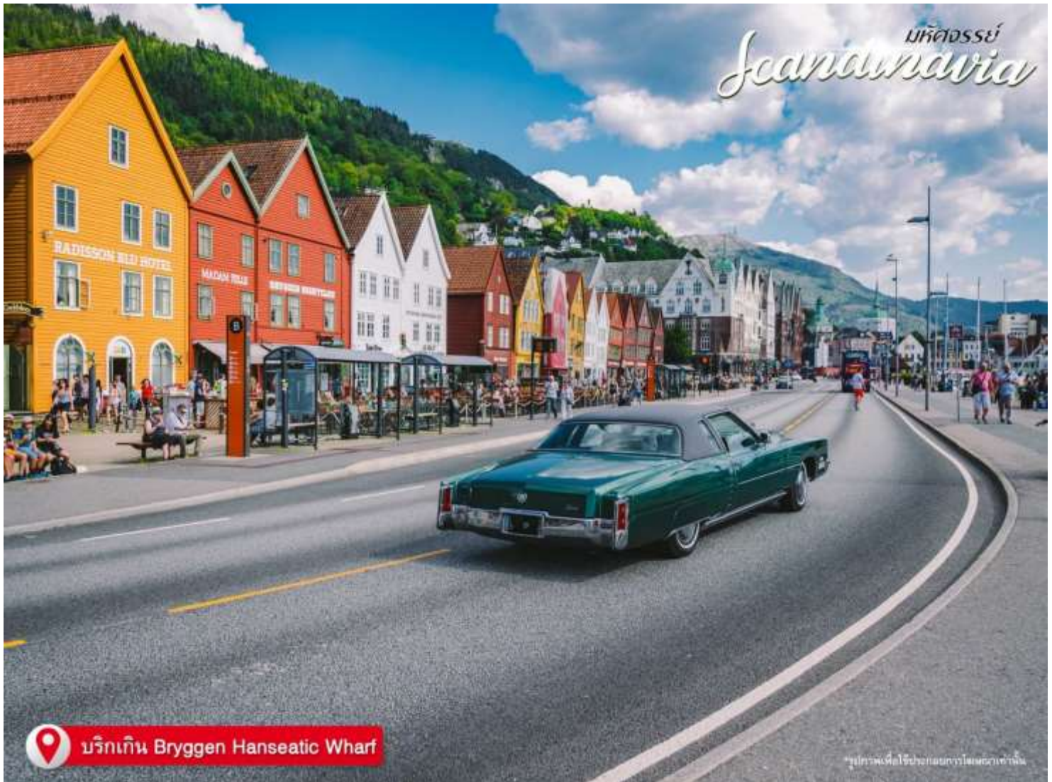
มริกเกิน Bryggen Hanseatic Wharf

ที่อยู่ : 18 ซ.บุญศิริ52(สุขุมวิท27) ถ.สุขุมวิท ต.ปากน้ำ อ.เมือง จ.สมุทรปราการ 10270 เวลาทำการ : จันทร์ - ศุกร์ 08.30-17.30 น. เสาร์ 8.30-12.00 น.