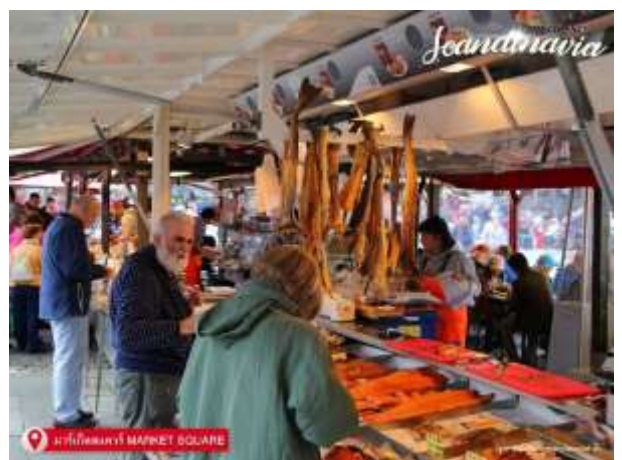
มริกเกิน MARKET SQUARE

มาร์เก็ตสแควร์ (MARKET SQUARE) ที่ปลาย ตะวันออกเฉียงใต้ของท่าเรือหลักที่สวยงามของเมือง Bergen's มาร์เก็ตสแควร์ (Torget) เป็นสถานที่ที่ ชาวประมงพื้นบ้านจับสัตว์น้ำได้ทุกเช้า มีสินค้าอาหาร ทะเลสดวางขายอยู่มากมาย ตลาดปลา (Torget) มีอายุ มากกว่า 700 ปี