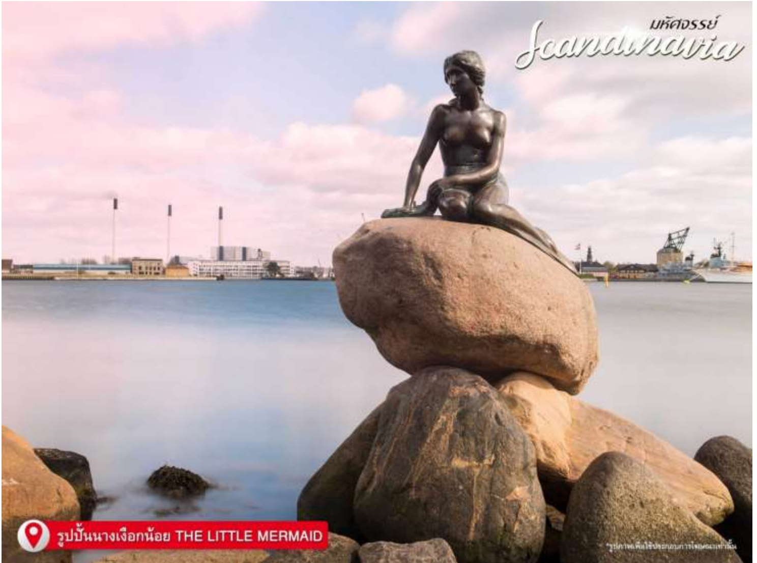
รูปปั้นนางเงือกน้อย THE LITTLE MERMAID