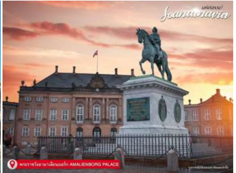
พระราชวังอาเมลิบอร์ก AMALIENBORG PALACE