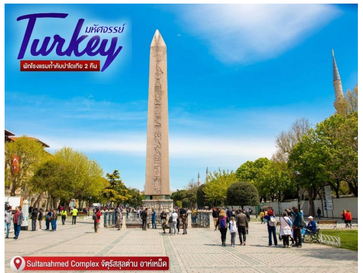
Sultanahmed Complex จัตุรัสสุลต่าน อาห์เหม็ด