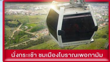
นั่งกระเช้า ชมเมืองโบราณเพอกาโมน