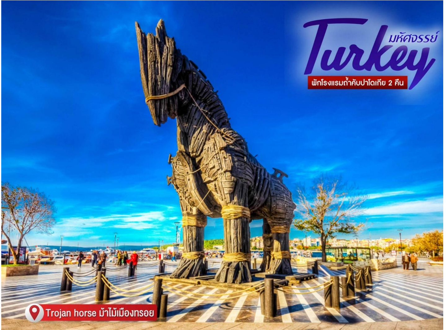
Trojan horse ม้าไม้เมืองทรอย

ที่อยู่ : 18 ซ.บุญศิริ52(สุขุมวิท27) ถ.สุขุมวิท ต.ปากน้ำ อ.เมือง จ.สมุทรปราการ 10270 เวลาทำการ : จันทร์ - ศุกร์ 08.30-17.30 น. เสาร์ 8.30-12.00 น.