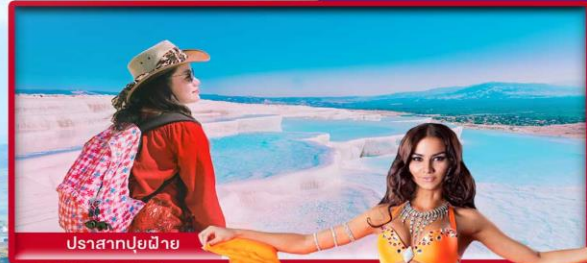
ปราสาทปวยมีาย