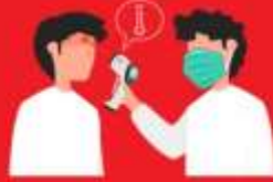
วัดไข้ผู้เดินทาง