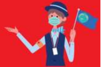
โกดิใส่แมสตลอดเวลา