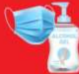
แจกแมส, เจล