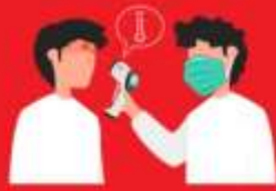
วัดไข้ผู้เดินทาง