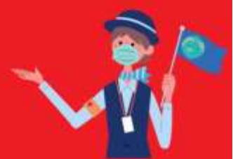
ไกด์ใส่แมสตลอดเวลา