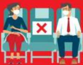
สายการบิน