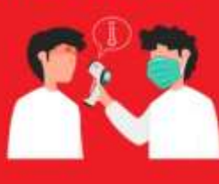
วัดไข้ผู้เดินทาง