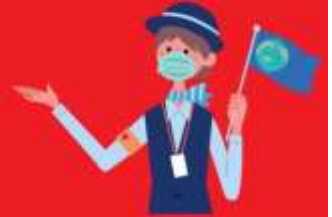
ไกด์ใส่แมสตลอดเวลา