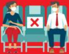
สายการบิน