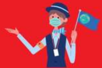
ไกด์ใส่แมสตลอดเวลา