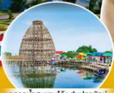
ตลาดน้ำสะพานโค้ง สุ่มปลายักษ์