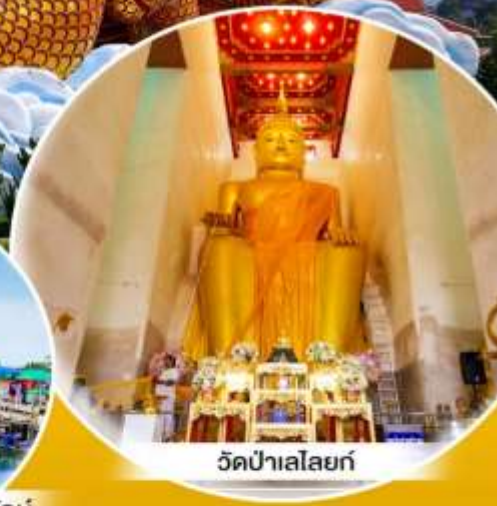
วัดป่าเลไลยก์

มหัศจรรย์ สุพรรณบุรี อำเภอเมือง · สามชุก