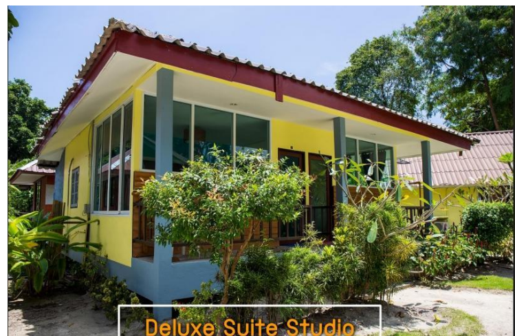
Deluxe Suite Studio