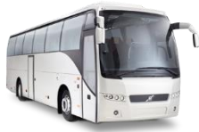
โดยรถบัสปรับอากาศ