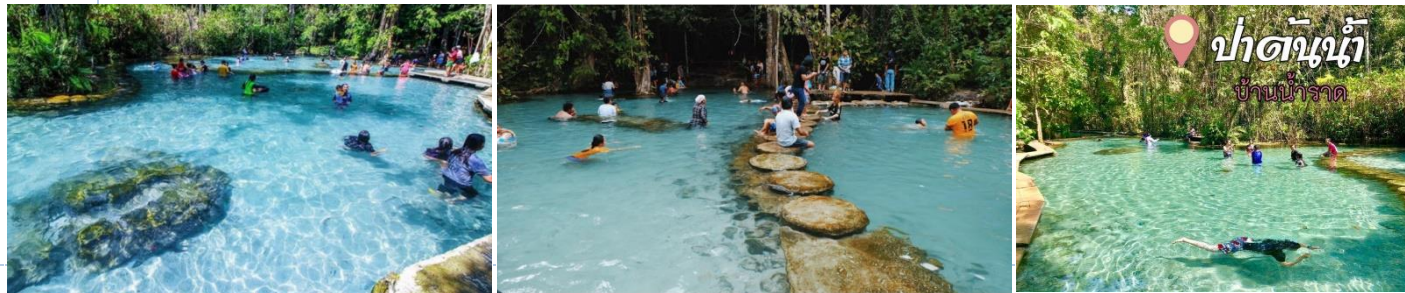
ป่าต้นน้ำ บ้านน้ำราด