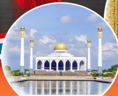
มัสยิดกลาง สงขลา