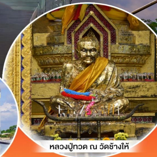
หลวงปู่ทวด ณ วัดช้างไห้