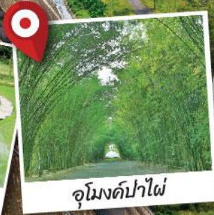
อุโมงค์ป่าไผ่