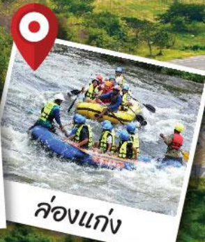
ล่องแก่ง