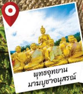
พุทธอุทยาน มามบูชาอนุสรณ์