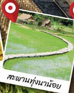
สะพานทุ่งนาน้อย