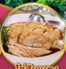
ไก่สับเบตง