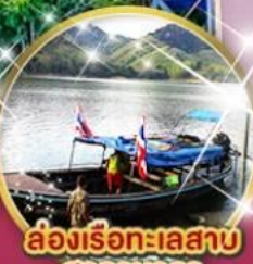
สองเรือทะเลสาบ ฮาลาบาลา

สตรีทอาร์ตเบตง, ตูโปรมณีโยโบราณ, สนามบินเบตง ปายใต้สุดสยาม อุโมงค์ปิยะมิตร ถ่ายรูปสุดเก๋กับต้นไม้พันปี เจ้าแม่ลิ้มกอเหนี่ยว ต้นไม้พันปี หมิ่นบุปผา แซ่เก๊าบ่อน้ำพุร้อนเบตง สวนหมื่นบุปผา, แซ่เก๊าบ่อน้ำพุร้อนเบตง, พาชิมเดากิวยเบตง ลิ้มรส ไก่เบตง เคาหยก จัมจุ่มปลาไหลสายน้ำไหล