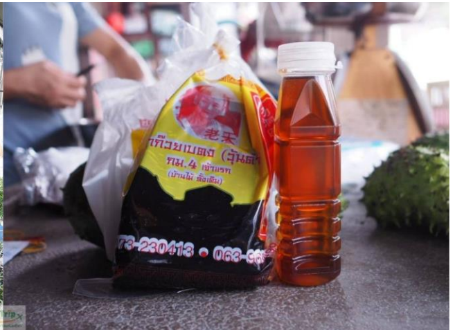
กลางวัน บริการอาหารกลางวัน พิเศษ...เมนูจิ้มจุ่มปลานิลสายน้ำไหลชื่อดังของเบตง

บ่าย นำท่านชม สวนหมื่นบุปผา หรือ สวนดอกไม้เมืองหนาว ตั้งอยู่ที่หมู่บ้านปิยะมิตร 2 สวนดอกไม้แห่งนี้อยู่ท่ามกลางภูเขา สูงจากระดับทะเลปานกลางราว 800 เมตร มีอากาศเย็นสบายตลอดปี เหมาะสมกับการปลูกไม้ดอกเมืองหนาวนานาชนิด สวนนี้เกิดขึ้นจากโครงการตามพระราชดำริสมเด็จพระเทพรัตนราชสุดาฯ ได้พระราชทานนามสวนแห่งนี้ว่า วานฮั่วหยวน หรือ แปลเป็นไทยว่า สวนหมื่นบุปผา โดยมีการพัฒนาให้เป็นแหล่งท่องเที่ยวและสร้างอาชีพให้กับกลุ่มผู้พัฒนาชาติไทยในอดีต ในชุมชนและหมู่บ้านบริเวณนี้ อดีตล้วนแล้วแต่เป็นสมาชิก พคม. ที่ประกาศตัววางอาวุธ ในปี 2532 เป็นผู้พัฒนาชาติไทย และเลือกที่จะพักอาศัยอยู่ในประเทศไทยต่อไป