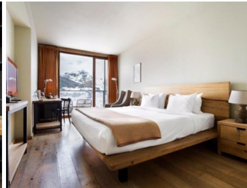
พักที่ Room Hotel Kazbegi หรือเทียบเท่าระดับ 4 ดาว