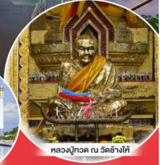
หลวงปู่ทวด ณ วัดช้างไห้