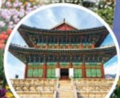
พระราชวังเคียงบกกุง (Gyeongbokgung Palace)