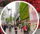
ย่านเมียงดง (MYEONG-DONG)