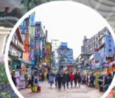
ย่านฮงแด (HONGDAE)