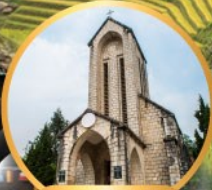
โบสถ์ซาปา