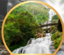
น้ำตกซิลเวอร์