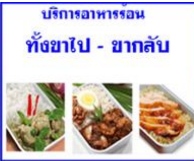
บริการอาหารร้อน ทั้งขาไป - ขากลับ