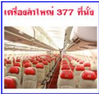
เครื่องบินแอร์บัส 377 ที่นั่ง