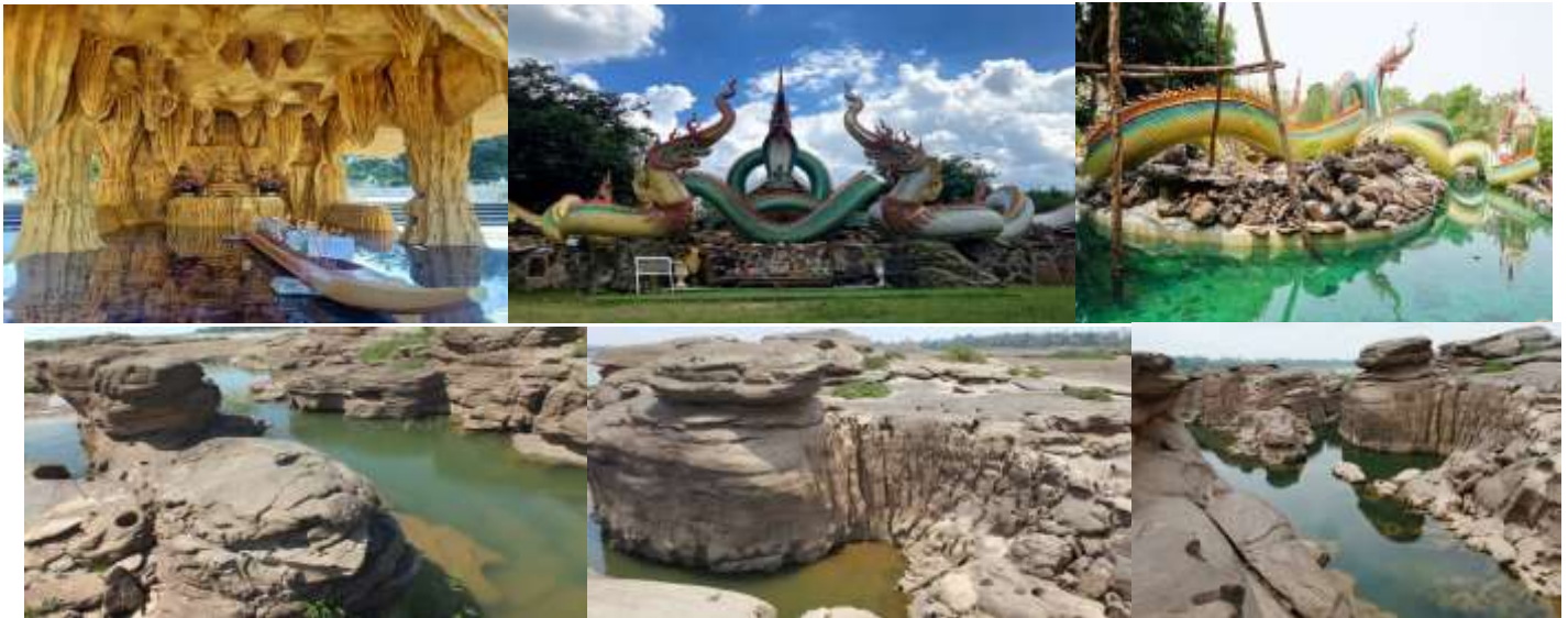
12.00 น. รับประทานอาหารกลางวัน(1)

ลักษณะคล้ายๆกับสามพันโบกที่มีความสวยงามตามธรรมชาติ มีหาดทรายขาวทอดยาวไปไกล อีกทั้งยังมี ลานกว้างไว้ให้นักท่องเที่ยวได้สัมผัสกับธรรมชาติในยามค่ำคืน