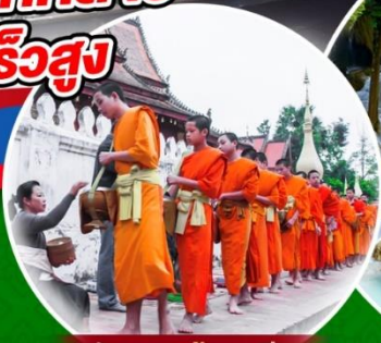
ดักบาตรข้าวเหนียว