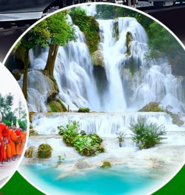
น้ำตกตาดกวางสี

มหัศจรรย์ หลวงพระบาง เวียงจันทน์ วังเวียง กุ้ยหลินแห่งเมืองลาว