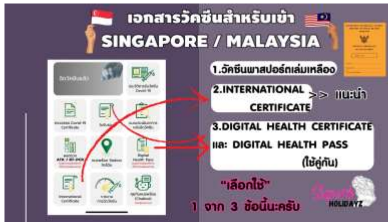
International Covid19 Vaccination Certificate

ไม่รวมค่าทิปไกด์+ค่าทิปคนขับรถเหมาจ่ายท่านละ 1,500 บาทชำระที่สนามบินสุวรรณภูมิ (ไม่รวมค่าทิปหัวหน้าทัวร์ตามความพึงพอใจ)