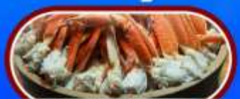
บุฟเฟ่ต์จางูชิกุ