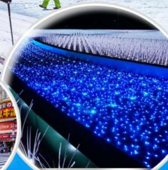
โตเกียวเมกะ อิลลูมินชั่น