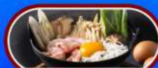
สุกียากี้ สโตว์ญี่ปุ่น