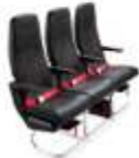
ที่นั่งมาตรฐาน

ราคา ที่นั่ง Hot seat ราคา 1,900 บาท / ที่ / เที่ยวบิน แถวที่ 7 ราคา 1,800 บาท / ที่ / เที่ยวบิน แถวที่ 15 , 16 , 17 ราคา 1,700 บาท / ที่ / เที่ยวบิน แถวที่ 34 , 35