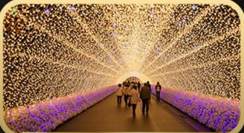
งานประดับไฟฤดูหนาวนาบานาโนะ ซาโตะ