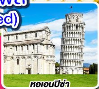
หออนปิซ่า