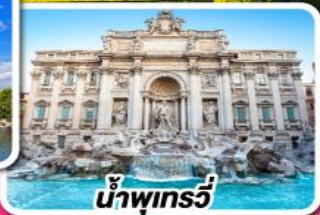
น้ำพุทรี