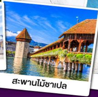
สะพานไม้ชาเปลา