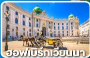
ฮอฟบวร์กเวียนนา