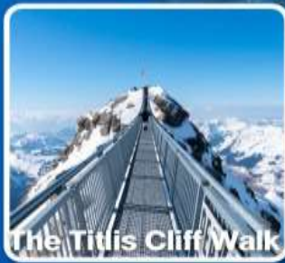
The Titlis Cliff Walk