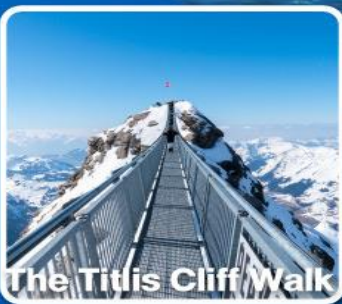
The Titlis Cliff Walk