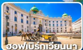
ฮอฟเบิร์กเวียนนา