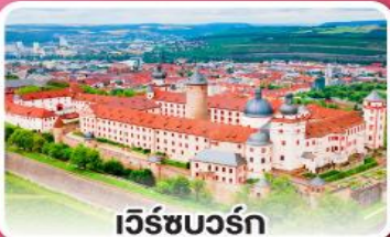
เว็ร์ชบวร์ค