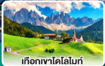
เทือกเขาโดโลไมท์