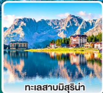
ทะเลสาบมิสุรีน่า

เข้าชมมหาวิหารเซนต์ปีเตอร์ ที่ใหญ่ที่สุดในโลกแห่งนครวาติกัน