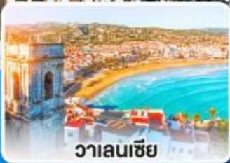
วาเลนเซีย