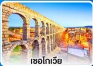
เซโกเวีย