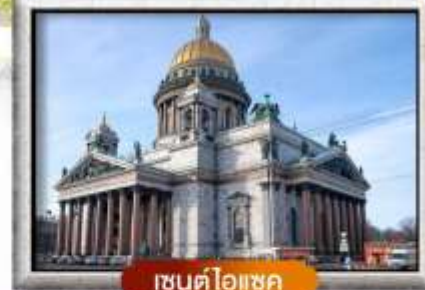
เซนต์ไอแซค