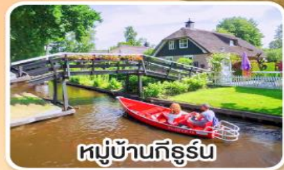
หมู่บ้านกังธูร์น