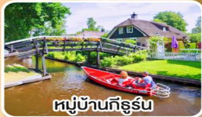
หมู่บ้านกังสุรินทร์