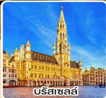
บริสเซลส์