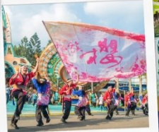
หมู่บ้านเก้าชนเผ่า