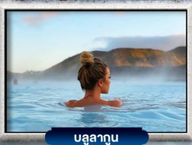
บลูลากูน