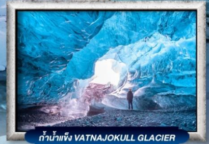
ถ้ำน้ำแข็ง VATNAJOKULL GLACIER

บินธุรกิจ Full Service | พิเศษ! ทานอาหารโดมกระจกิว 360 องศา