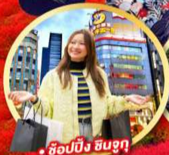
• ช้อปปิ้ง ซินจูกุ

• กิจกรรมใส่ชุดกิโมโน พร้อมชมโชว์การแสดงต่างๆ