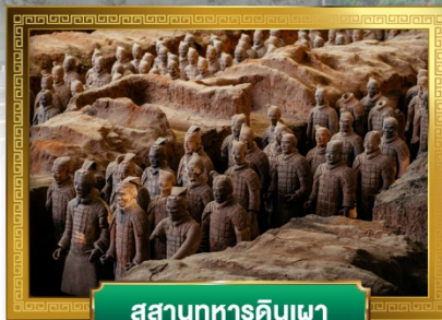
สุสานทหารดินเผา