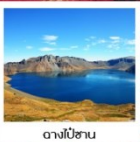
อางไป่ซาน