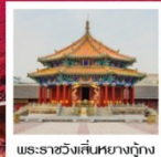
พระราชวังเสียนหยางวัง

หาดหญ้าแดง / พระราชวังเสียนหยางวัง / ถนนโบราณบ้านชิง / ถนนคนเดินจงเจีย อุทยานอางไป่ซาน / สรมารถ / ป่าตอถางไป่ / ทะเลสาบเทียนฉือ / บ่อน้ำร้อนจิหลง หมู่บ้านโบราณกาหลี่ / สวนพฤกษศาสตร์กาหลี่ / จตุรัสใบพัดเซี่ยงหยาน / สะพานรถไฟไป่โจว อนุสาวรีย์ผิงฝง / ถนนคนเดินจงหยาง / โคมระย้าผานเจียง