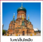
โบสถ์เซี่ยงหยาน