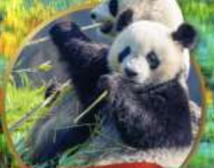
หมีแพนด้าเจียงเยียน