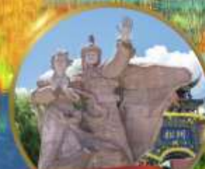
เมืองโบราณชงพาน