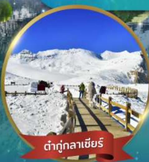
ต้าตุ่กลาเซียร์