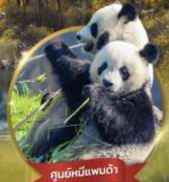
สวนหมีแพนด้า

เที่ยวชมความงาม 3 อุทยานชื่อดัง : สี่ดรุณี • ปี้เหิงโก ต้าตุ่กลาเซียร์ ชมความน่ารักของหมีแพนด้า • จัตุรัสหยางเทียนวู่ ชอยกว้างชอยแคบ • ถนนคนเดินซุนซีสู๋ • POP MART