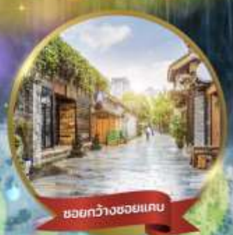
ชอยกว้างชอยแคบ