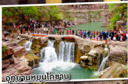
อุทยานหยุนโกซาน