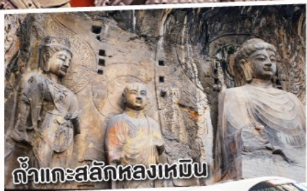
ถ้ำแกะสลักหลงเหมิน