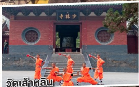
วัดเส้าหลิน