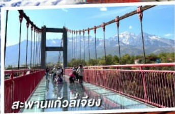
สะพานแก้วลี่เจียง