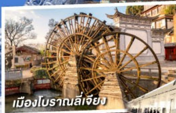
เมืองโบราณลี่เจียง