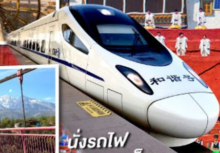
นั่งรถไฟ ความเร็วสูง