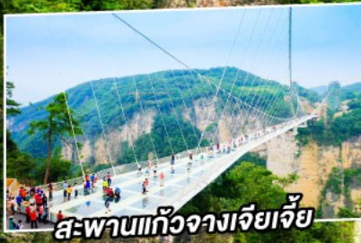
สะพานแกว่งฉางเจียเจีย