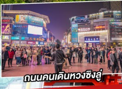
ถนนคนเดินหวงซิงลู่