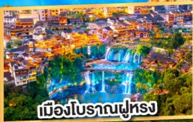
เมืองโบราณฟูหลง