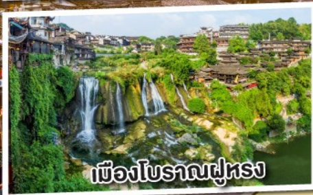
เมืองโบราณฝูหลง