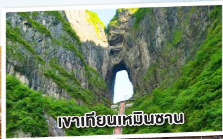
เวาเทียนเหมินซาน

จางเจียเจีย เทียนเหมินซาน เวอวตาร สะพานแก้ว เมืองโบราณฝูหลง เฟื่องหวง 5 วัน 4 คืน